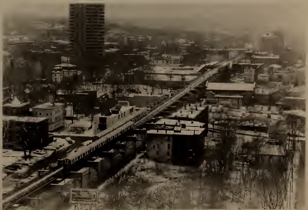
View of Egleston Station Area.

Para cualquier información adicional acerca del programa o de los otros programas de Artes en Tránsito, favor de dirigirse a Sylvia Hill, 722-5910, en el MBTA, o a Urbanarts, Inc., P.O. Box 1658, Boston, 02205, 262-2246.